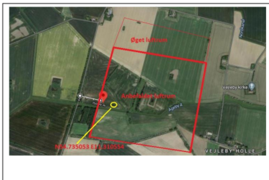
Figur 01. Luftrum markeret med rød.